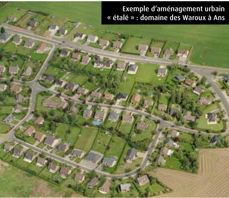
Exemple d'aménagement urbain « étalé » : domaine des Waroux à Ans

Question 89 : qu'est-ce qui fait la qualité de vie d'une ville?