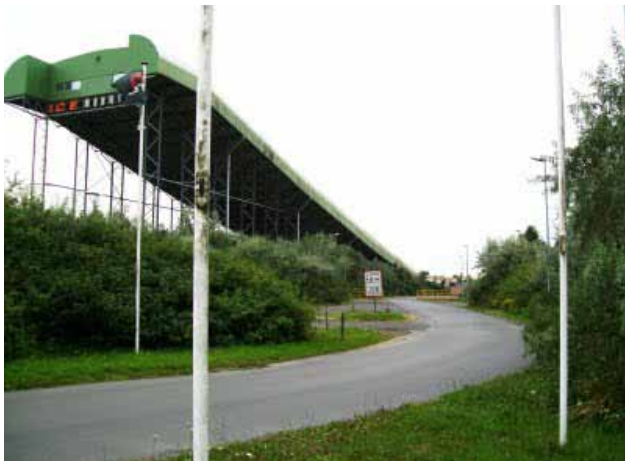
Ice Mountain, à Comines-Warneton, la montagne de glace, qui ressemble surtout à un tunnel couvert de plastique juché sur pilotis?

Question 38 : la sensibilité à l'environnement est-elle perceptible dans toutes les rubriques?