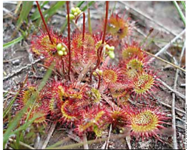
NOAH ELHAROTY / WIKIPEDIA