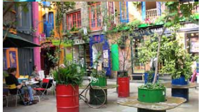
Neil Yard à Londres, bel exemple de reconversion urbaine.

HTTP://JODETORACITY-SHOREDITCH.BLOGSPOT.COM